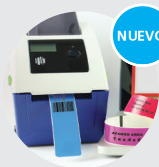
Impresora de pulseras