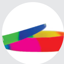
Colores en diagonal