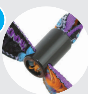
Cierre de alta seguridad