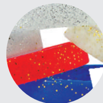
Dorado o plateado brillante