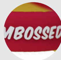
Relieve + Serigrafía