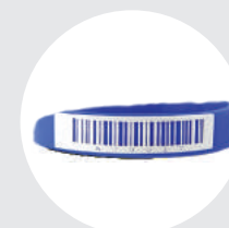
Código de barras* 1D