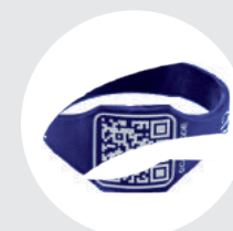
Código de barras 2D / Código QR**