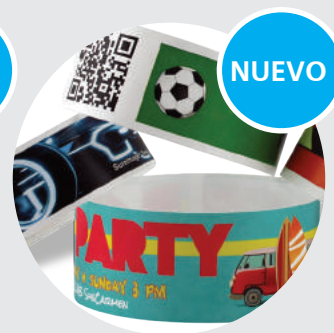
Pulseras de Tyvek® a todo color