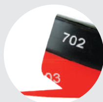
Láser + 1 color impreso